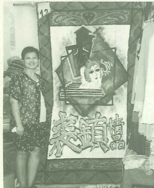
公明街「賽旗精品」在賽旗畫作上表現時髦的現代感

農曆五月初「文化賽旗」亮麗開展，從公明街沿中正路、三民街直到紅毛城為止，到處都可以看到一幅幅製作精美的賽旗，每家店都是精心製作，紛紛把自己店的特色表現出來，有的店打破平面思考，創作出立體的作品；有的保留一點樸實的味道，耐人尋味；有的是動員全家、享受創作的樂趣，賽旗作品形形色色、美不勝收！！文化賽旗本來就是一場規模龐大的社區運動，評審評分的方式不全依作品呈現的美術技巧作為評分標準，而是以由店家用心思考、親手創作、一齊參與的過程為重點！