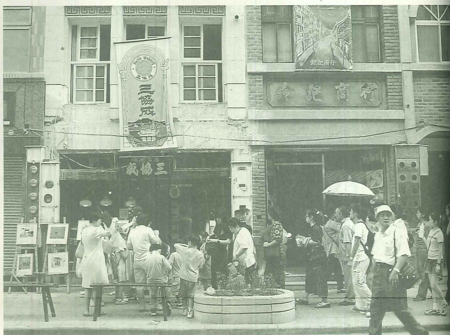
三協成餅舖陳列許多老式的糕餅模具，成為遊客參觀遊覽的焦點

各店家的歷史背景，更重要的是期望透過店史製作能串聯起街區共識，讓街區的居民重新對本地產業文化的認同感，讓大家意識到產業發展是息息相關的，淡水的在地文化是需要來共經營的。希望先藉由一小部份的店史成果來拋引玉，期待發揮標竿的作用，促成更多店家認來製作屬於淡水的店史。