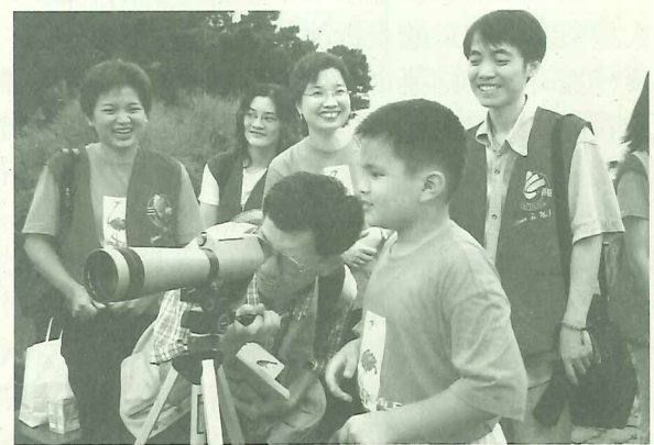
小朋友也迫不及待想一探鳥兒美麗的身影

捷運列車進入淡水終站前，映入眼簾的，就是一片片的綠蔭紅樹林、一群群飛鳥結伴同行和襯著海平面上的夕陽彩霞，構成一幅令人心怡的淡水風情。我們滿心期盼今日所見的好山好水，還有機會能帶親愛的家人、朋友來到這裡享受大自然；而不是讓這些生活中原有的美麗一一消逝，成為孩子們課堂要學習的「鄉土教材」——讓那些景物已非的舊照片來填補我們對這片土地的記憶。