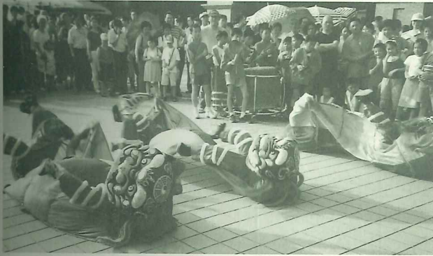
淡水國小醒獅團生龍活虎的演出，吸引眾多遊客圍觀

此次文化五月節，還邀請二十位藝術以彩筆寫生，爲2000年的淡水景觀留下見證，「藝術家畫淡水」聯展展期自七月十一日至廿三日止在淡水藝文中心展出，七月十五日聯展茶會上同時舉行「文化賽旗」頒獎典禮，2000年淡水文化五月節就在「藝術家淡水」聯展結束後，畫下句點。