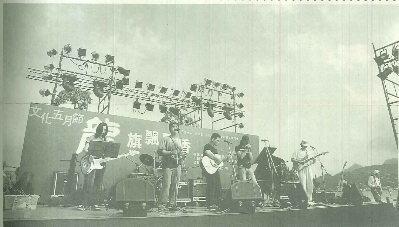
音樂表演團隊6月3日下午在淡水捷運站舞台暖身準備

「千秋韻事在端陽」是一場高水準盛會，雖有場地、器械的小瑕疵，但整體所呈現的水平，可說是咱淡水地區難得一見的藝文佳會，我們希望能年年有此雅集，來傳唱中國、台灣、淡水不朽的詩歌！！