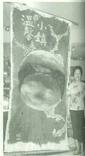
「溫馨小鎮」店旗以溫和的卡其色襯托店內溫馨感覺

活動結束了，也許不能用來觀光客的眼來評價這次的文化賽旗，重要的是居民參與的情及對社區的認同吧！